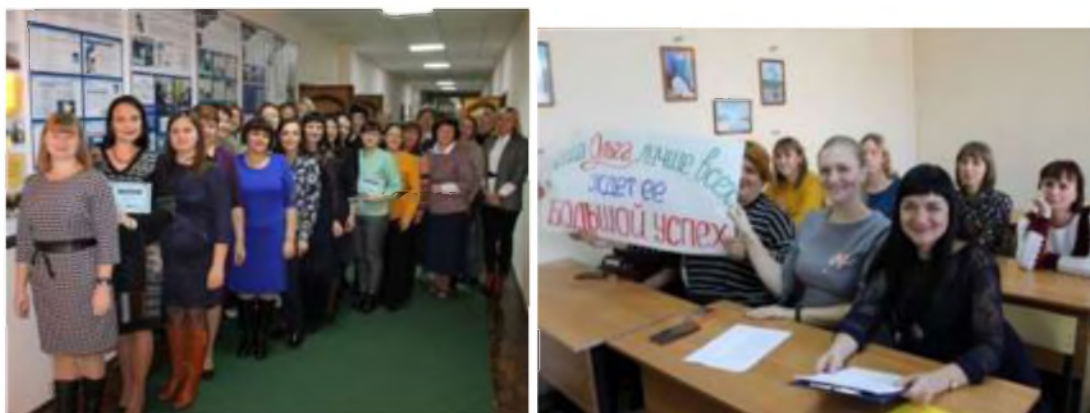
Региональный профессиональный конкурс учителей-логопедов дошкольных образовательных и общеобразовательных организаций «ЛОГО-Мастер»

областной конкурс методических и проектных разработок по финансовой грамотности в рамках региональной образовательной акции «Финансы в нашей жизни».