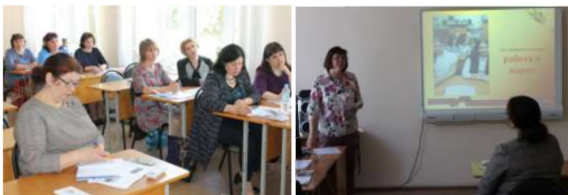
Конкурс «Мой лучший урок истории, посвященный великой Победе»