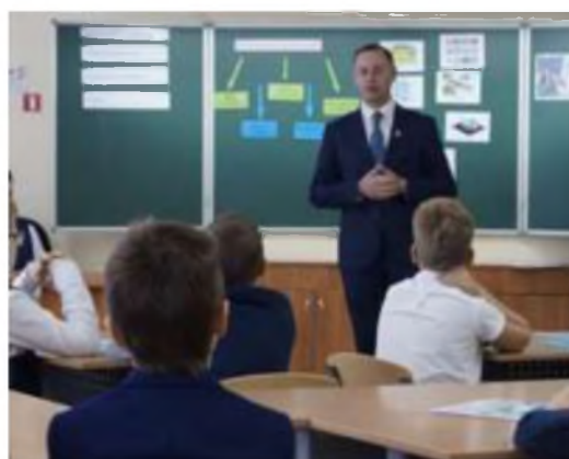
Всероссийской образовательной акции «Урок цифры»

Подготовлены и изданы материалы лучших практик организации Дня открытых дверей работы стажировочных площадок в рамках региональных недель географии и математики (Рыльский и Курчатовский районы).