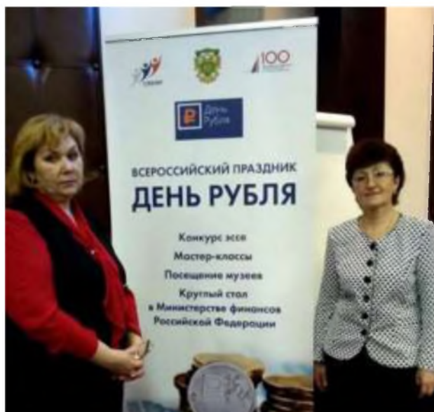
Региональный этап межрегионального конкурса эссе «День рубля»