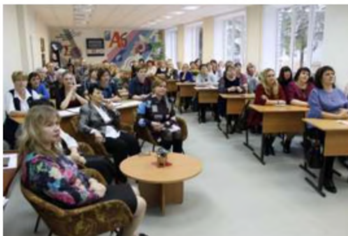
Региональный фестиваль стажировочных, апробационных, инновационных площадок дошкольных образовательных организаций

Наиболее масштабными научно-методическими мероприятиями года стали Региональный фестиваль стажировочных площадок и Всероссийский образовательный форум «Перспективы развития дополнительного профессионального педагогического образования», посвященные празднованию 85-летия ОГБУ ДПО КИРО.