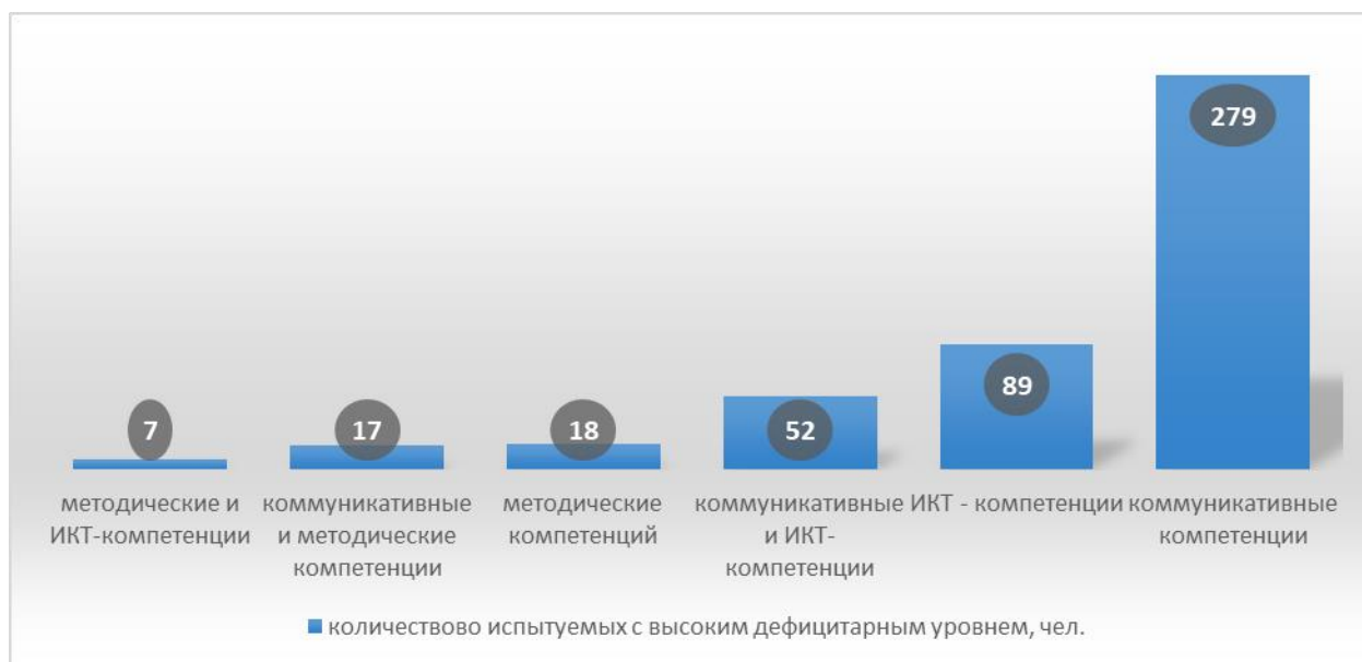
Рисунок 2. Количество испытуемых с высоким дефицитарным уровнем по 3-м видам компетенций и их комбинациям

Кроме того, выявлены группы педагогов, имеющих равные дефицитарные уровни одновременно по 2-м группам компетенций: методическим и ИКТ – 7 (1%), коммуникативным и методическим – 17(3%), коммуникативным и ИКТ-компетенциям – 52 (9%) педагога.