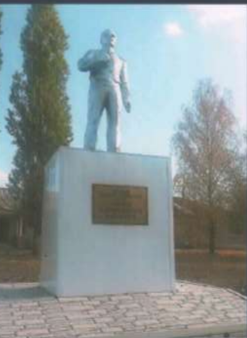
Памятник Ю.А.Гагарину площадь СПК им.Гагарина, Черемисиновский район, д.Ефремовка