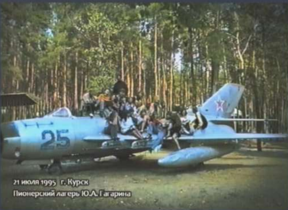
21 июля 1995 г. Курск Пионерский лагерь Ю.А. Гагарина

Ежегодно работает в 3 смены, принимает до 500 детей работников и военнослужащих Министерства обороны РФ, других учреждений и организаций города Курска, Курской области, Москвы и Московской области.