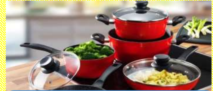
ФОТО – ВИДЕО – ПРЕЗЕНТАЦИИ – ССЫЛКИ